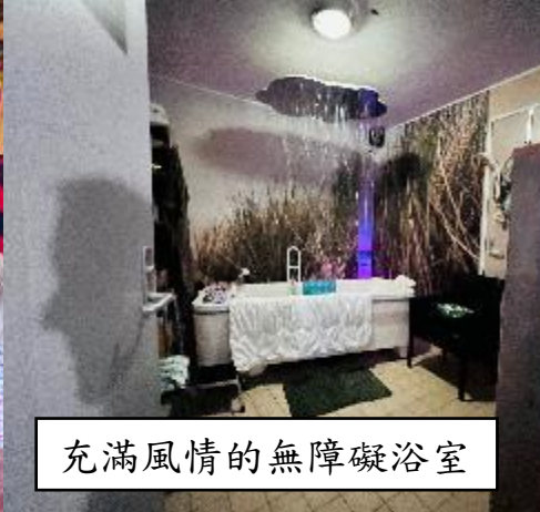
充滿風情的無障礙浴室