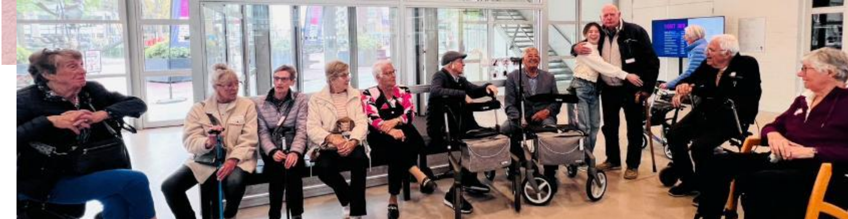
下車比紅毯盛大 ——Museum Plus Bus抵達現場