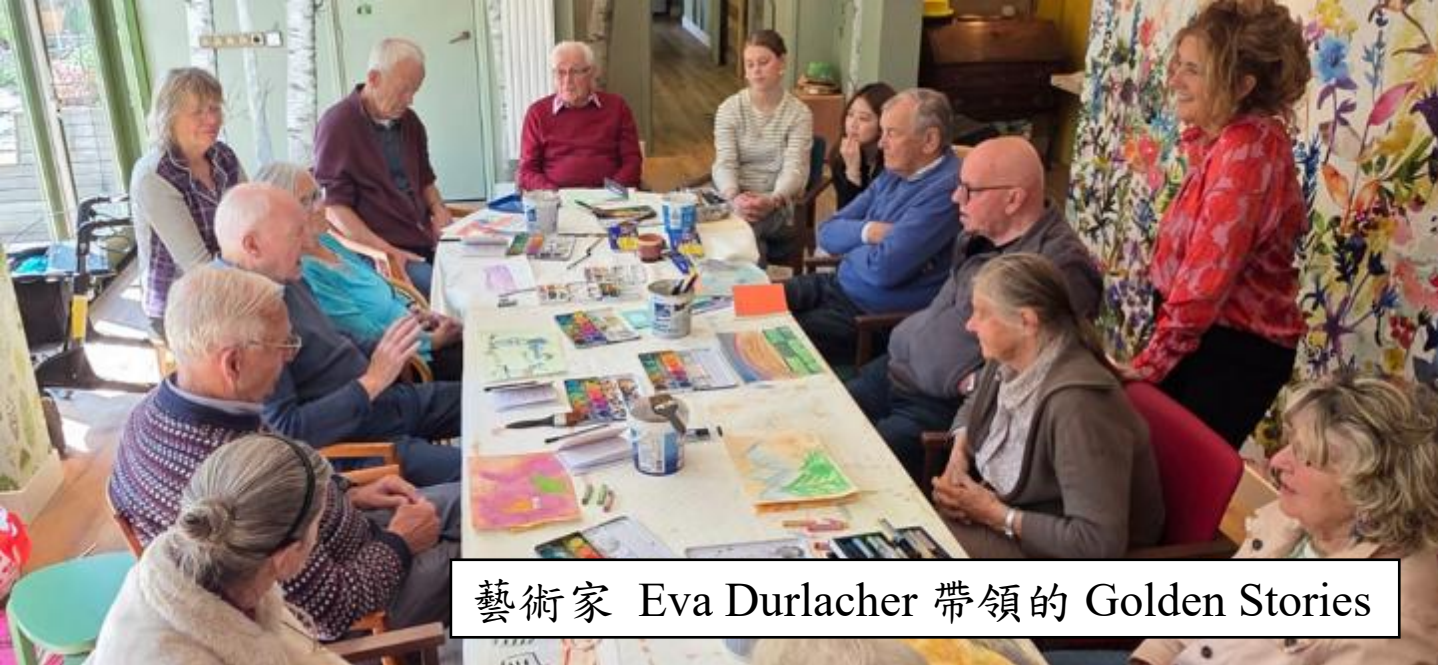
藝術家 Eva Durlacher 帶領的 Golden Stories