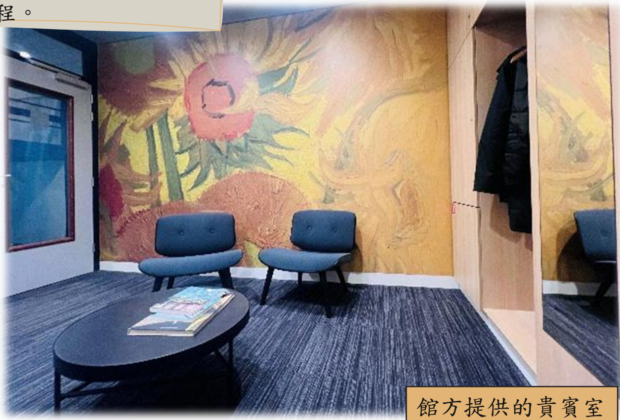
館方提供的貴賓室