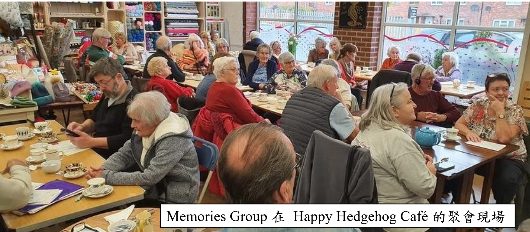
Memories Group 在 Happy Hedgehog Café 的聚會現場