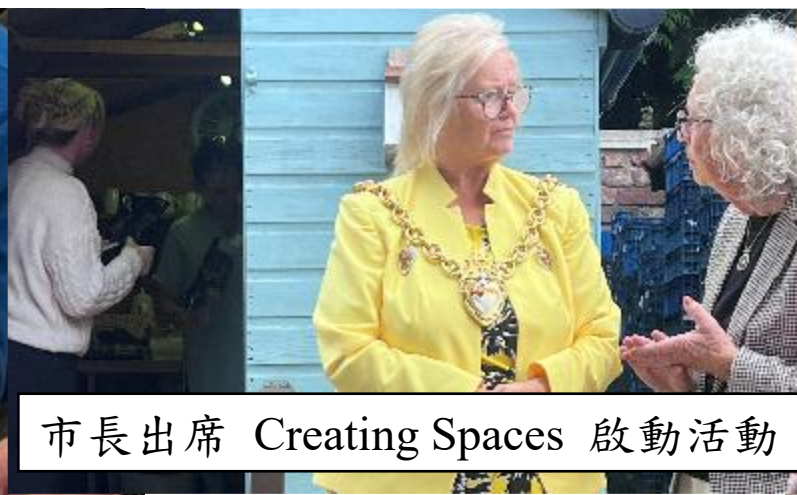
市長出席 Creating Spaces 啟動活動