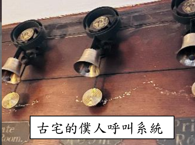
古宅的僕人呼叫系統