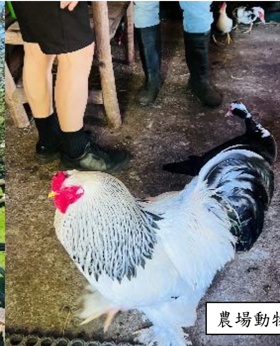
農場動物成為生活夥伴