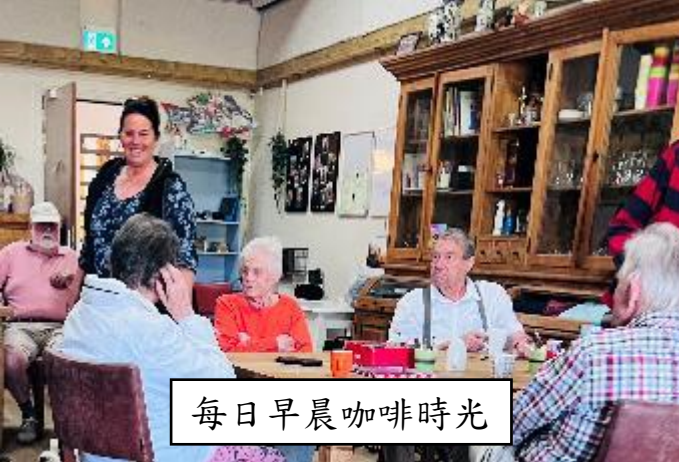
每日早晨咖啡時光