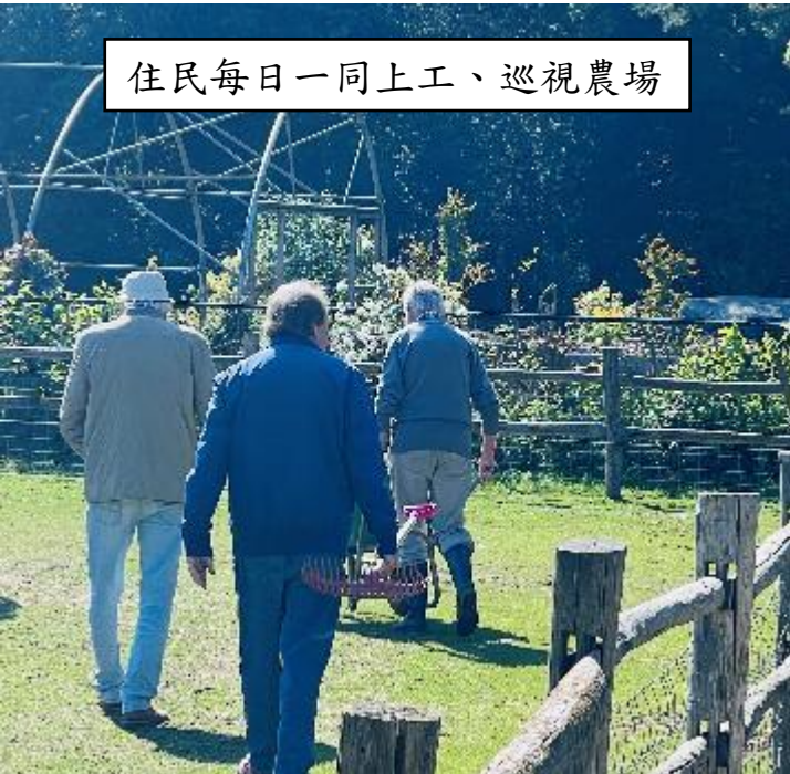
住民每日一同上工、巡視農場