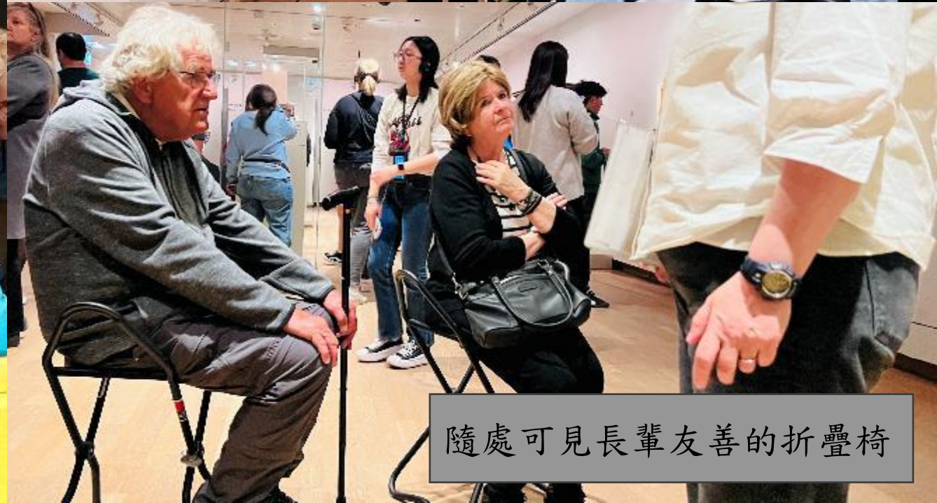
隨處可見長輩友善的折疊椅