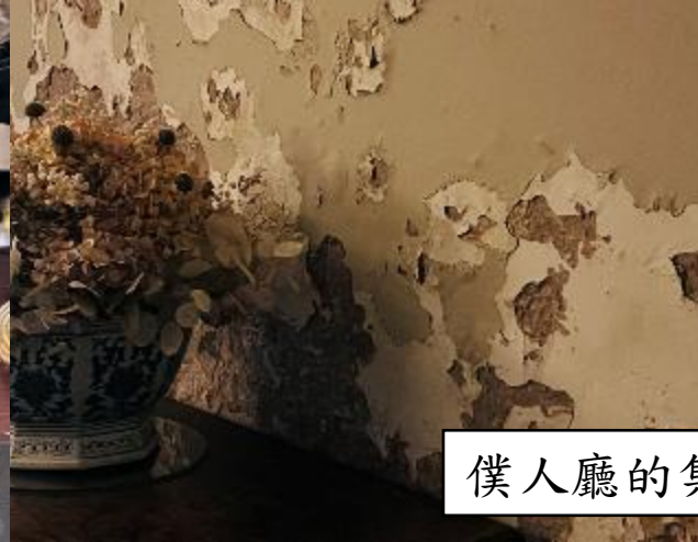
僕人廳的集合用餐場所