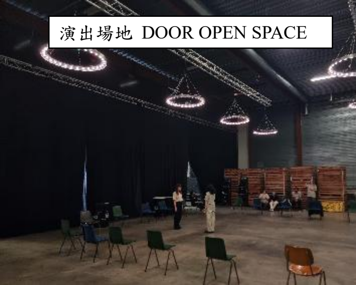
演出場地 DOOR OPEN SPACE