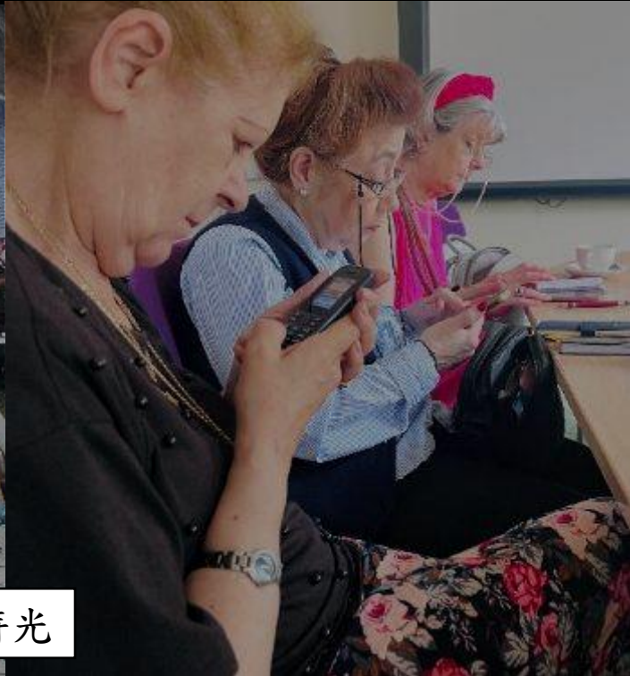
Fortnightly Coffee Morning —— 英國長者的悠閒社交時光

在倫敦的 Hotel 63，每兩週舉行一次的 Fortnightly Coffee Morning，是由 Age UK Westminster 主辦的活動。這裡聚集了一群優雅又活躍的長者，活動氛圍像是一場有錢老奶奶的社交早茶會——桌上擺滿了熱咖啡與甜餅乾，大家邊聊天邊分享最近的生活瑣事與健康心得。不少參加者都像年輕人一樣忙碌：有人掏出舊式手機記錄下次活動的時間，有人則用紙本行事曆認真抄寫。他們的日程表排得滿滿的，因為 Age UK 為高齡者設計了許多活動——例如：藝術手作課 (Arts & Crafts)、輕運動瑜珈班 (Gentle Exercise / Yoga)、音樂下午茶 (Music & Singing Group)、科技教室 (Digital Skills Workshops) ……等等。此安排讓長者保持社交連結，也展現了英國高齡者越老越精彩的生活態度。他們不被年齡束縛，反而透過不斷參與活動，讓每一天都充實、有趣、值得期待。這正是社區支持老化 (Community-based Ageing Support) 的最佳實踐，也與台灣據點推動「在地老化」的理念不謀而合。