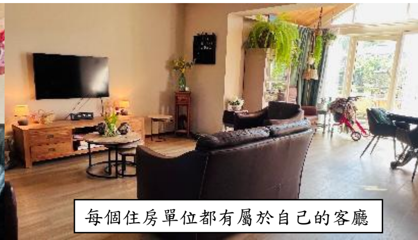
每個住房單位都有屬於自己的客廳