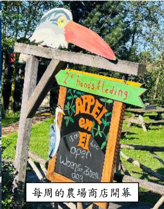
每月的農場商店開幕