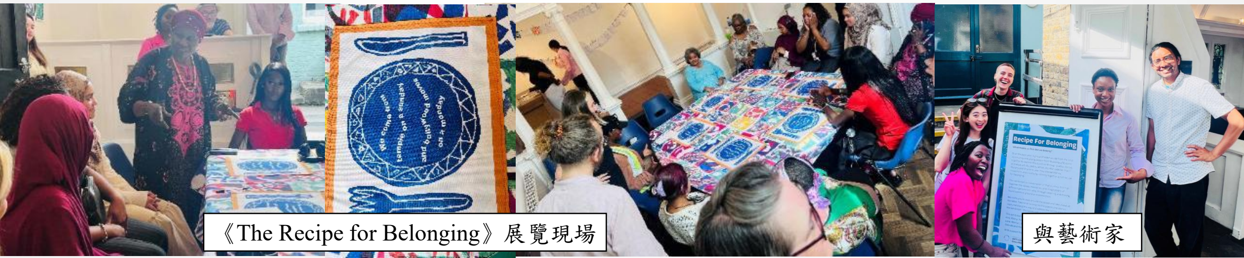
《The Recipe for Belonging》展覽現場

Magic Me 成立於 1989 年，是英國最早專注於「跨世代藝術交流」（intergenerational arts）的組織之一。它的理念是讓不同年齡層的人在藝術活動中「平等相遇」，不以照護、教育或輔導為出發點，而是以「共創」為核心。這種模式讓長者不再被視為需要照顧的對象，而是故事與創造力的承載者。同時，年輕參與者也在合作過程中理解老年生活的多樣面貌，進而打破年齡與刻板印象的界線。