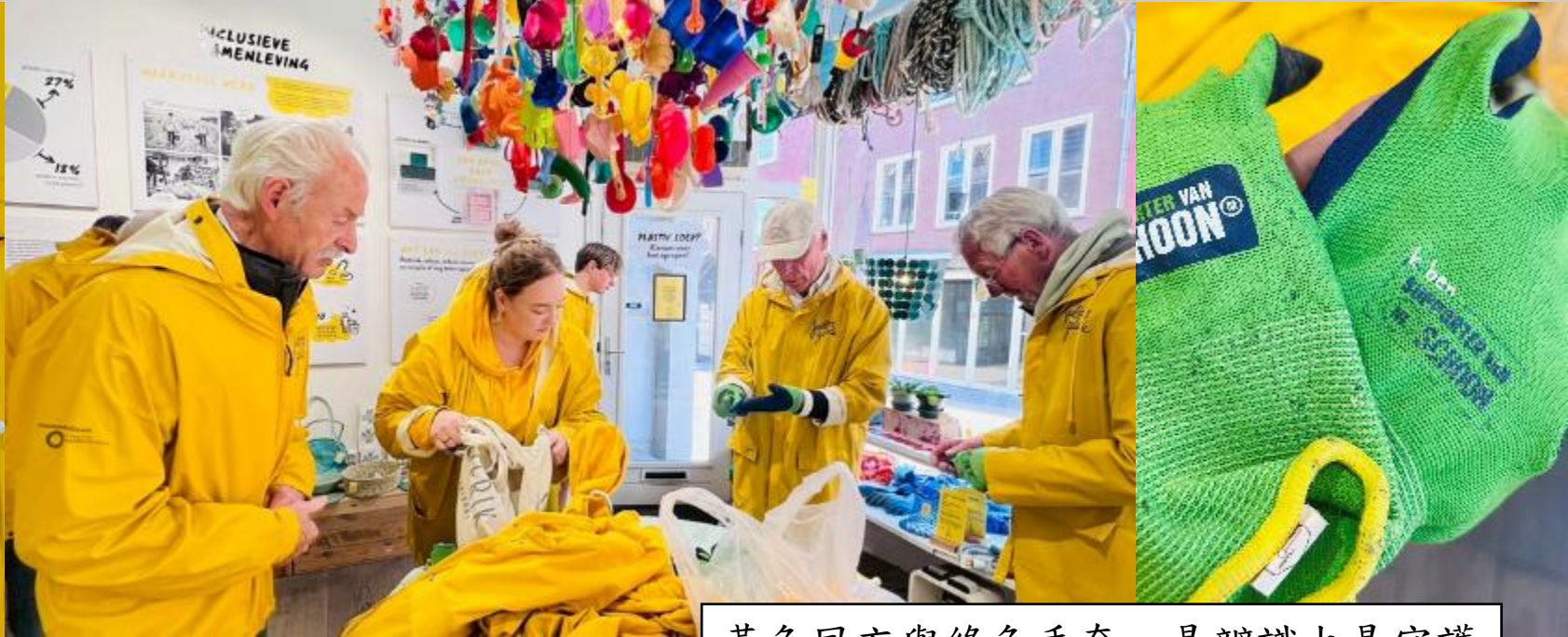
任務第一關，打開鐵倉庫。