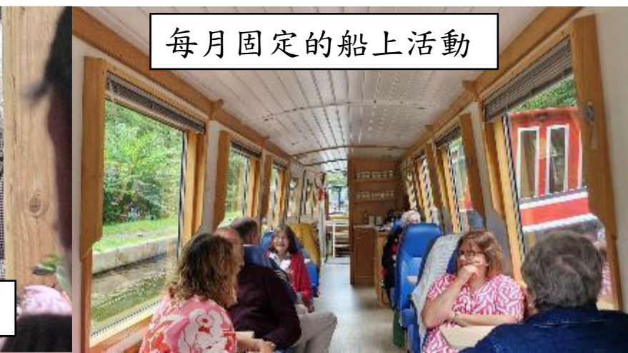
每月固定的船上活動