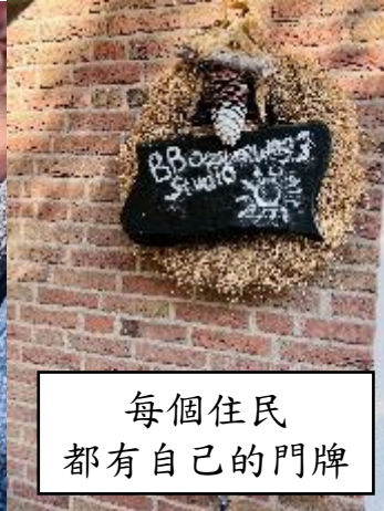
每個住民 都有自己的門牌